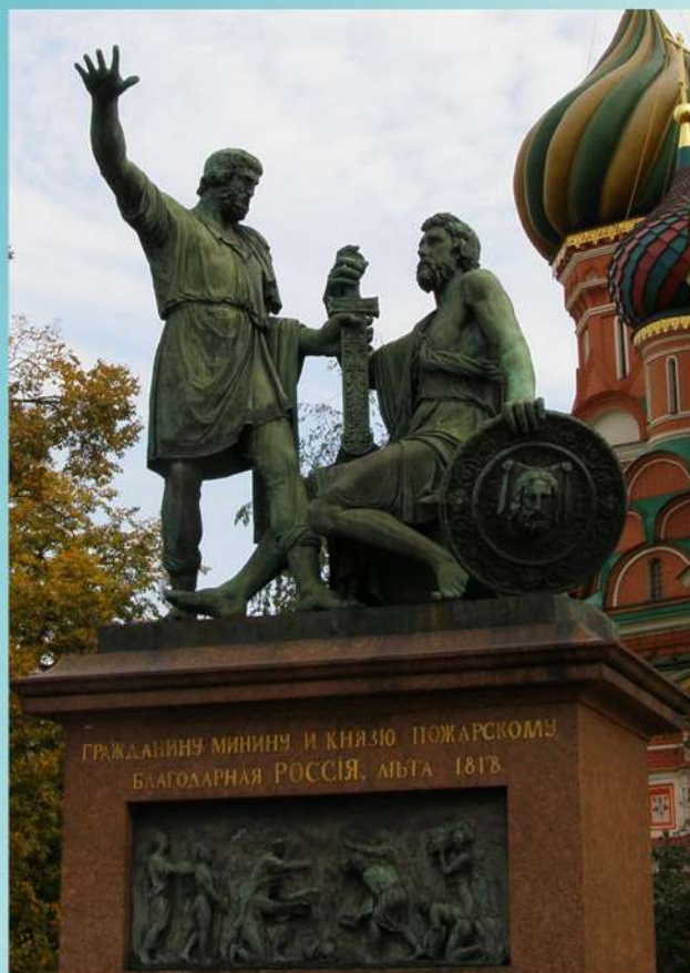
Памятник Минину и Пожарскому работы скульптора И. П. Мартоса (1752 - 1835) - один из самых известных памятников Москвы. Он создавался с 1804 по 1815 гг. на народные пожертвования и был установлен 20.02.1918 г. (по старому стилю) на Красной площади напротив входа в Верхние торговые ряды.

И поднималась Русь с колен В руках с иконой перед битвой, Благословленная молитвой Под звон грядущих перемен.